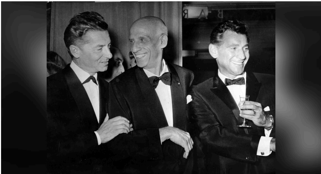
Klassisches Gipfeltreffen: Herbert von Karajan (l.) und Leonard Bernstein (r.) nach einem Konzert des New York Philharmonic bei den Salzburger Festspielen 1959. Auch der Herr in der Mitte ist kein Unbekannter: der Dirigent Dimitri Mitropoulos, Bernsteins Vorgänger auf dem Chefposten in New York.

Entstanden ist ein „very well made play“ auf sparsam möbliertem Raum, ein aufmerksam inszenierter Dialog zweier epochaler Künstler-Egos, bei dem noch nicht einmal groß stört, dass es manchmal nach vertheaterten Wikipedia-Einträgen klingen könnte, wenn die beiden sich mit Erinnerungen an die eigenen Triumphe oder die Skandale des anderen bewerfen.